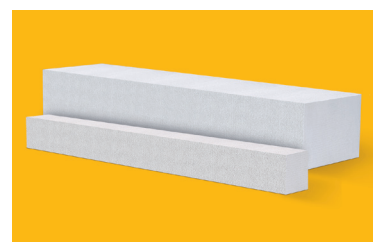
Belki nadprożowe YTONG

YTONG YN to gotowe nadproża ze zbrojonego betonu komórkowego – samodzielne elementy nośne przeznaczone do przekrywania otworów do szerokości 1,75 m. Montaż tych nadproży zajmuje dwóm pracownikom tylko kilkanaście minut.